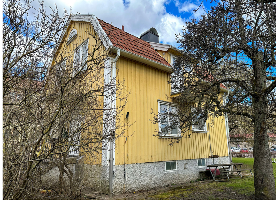
Villan från 1929 står kvar än i dag.