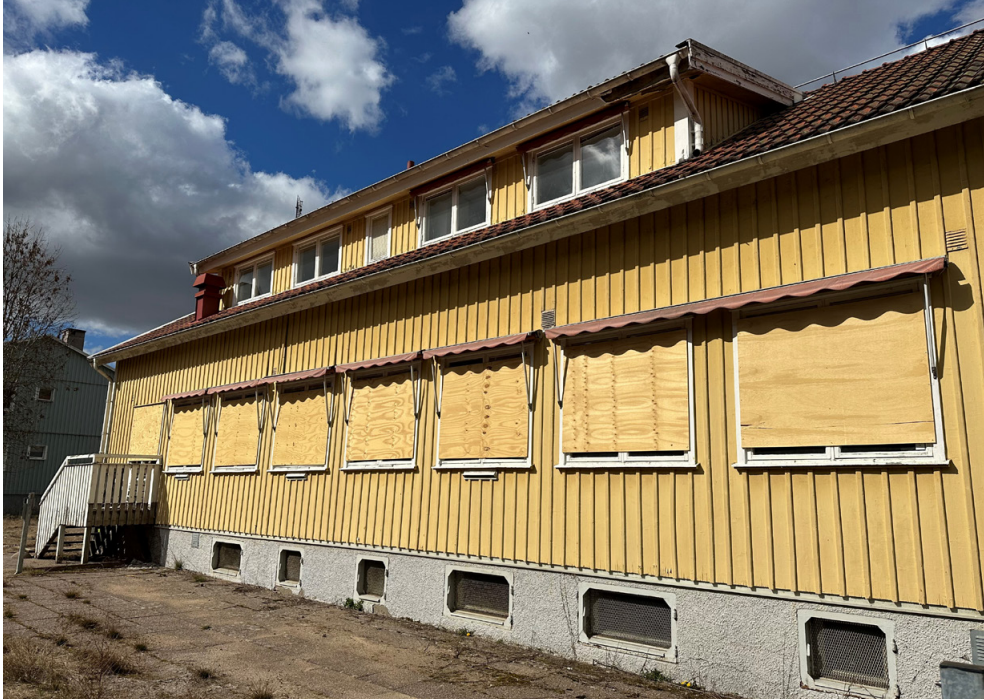
Den större byggnaden från 1944.