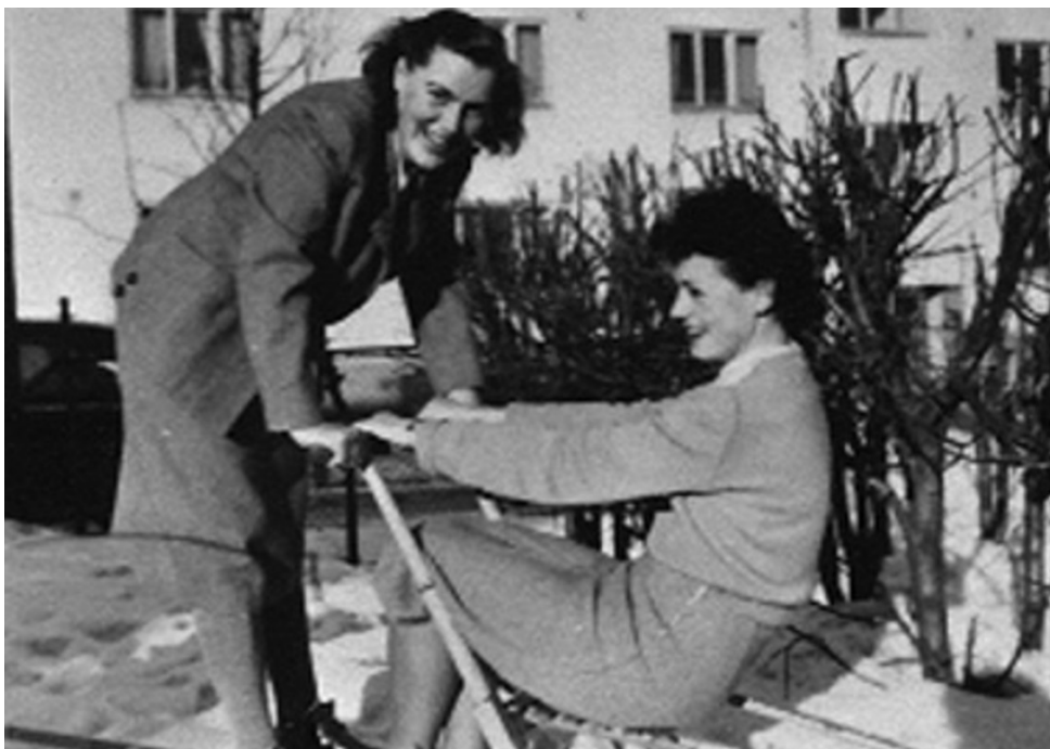
Förskolepedagoger på gården.